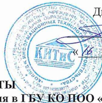
ГРАФИК РАБОТЫ объединений дополнительного образования в ГБУ КО ПОО «КИТиС» на первое полугодие 2022-2023 учебного года